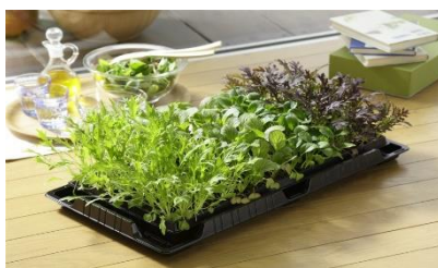
葉菜3種の栽培 ミズナ・コマツナ・カラシナ