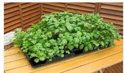
ハーブ3種の栽培 パクチー・スイートバジル・クレソン