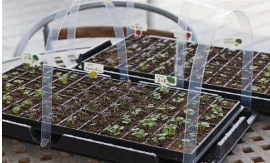
フレームを立てたらネットを被せる

家庭菜園で失敗する原因で1番多いのが「虫に食べられた」です。トレイ栽培でも防虫ネットなどを使用して対策をしましょう！ネットの上からでも水やりができます。