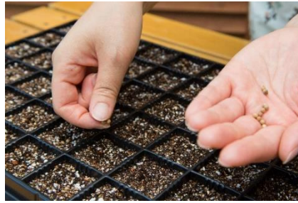
指で穴を開けた所にタネを播いて、その後、表面が湿る程度に水をやる