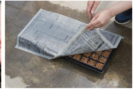
日陰になるよう新聞紙をかける方法