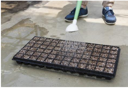
底面から水が出るくらいに水をやる