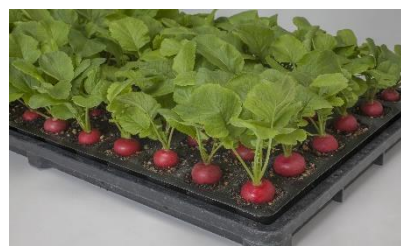
ラディッシュ(二十日ダイコン)『ニューコメット』