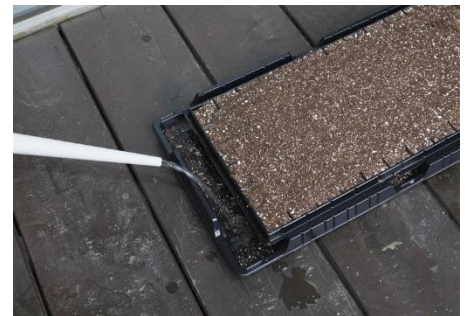
生育途中は底面給水バットに水を入れる

★底面給水バットに水を入れておくことで、1～2日留守にする場合も水やりの心配はありません。