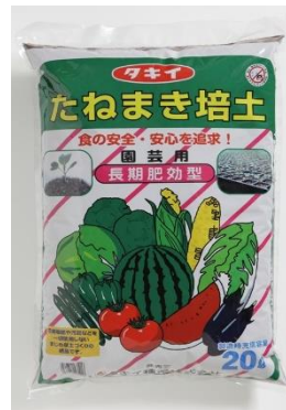
タキイおすすめ培養土！ 「たねまき培土」