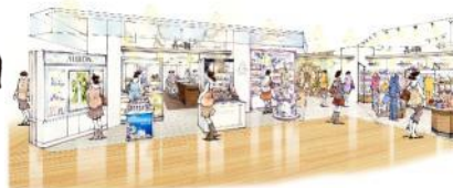
のどかで温かい空間で、 貴方に合ったコスメ・インナーを お探しいたします。