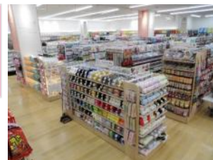
約1.5倍の広さに 拡大移転リニューアル！