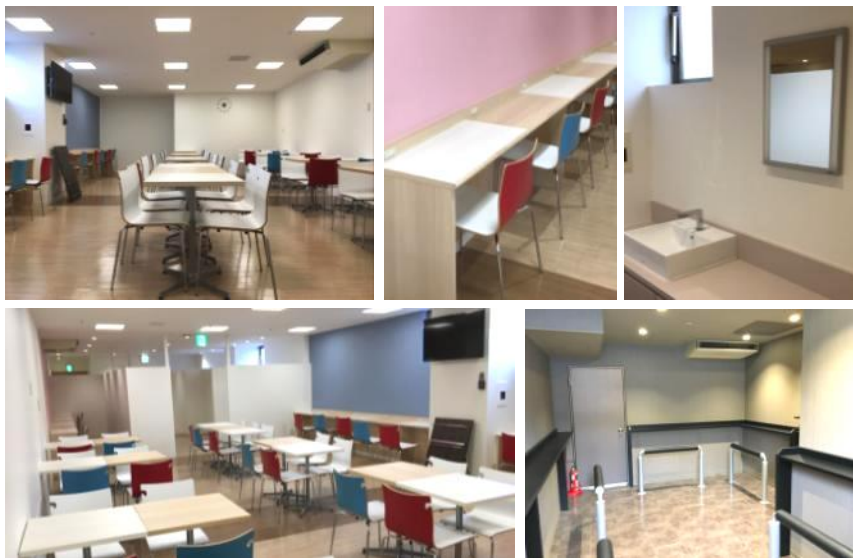
歯磨きもできる洗面台、携帯電話充電用コンセントを設置、喫煙室を新たに併設

従業員が休憩時間を快適に過ごせるよう、充電コンセントの設置等、カフェのような癒しの空間をコンセプトに従業員休憩室をリニューアルしました。当社グループは、大切なパートナーである従業員の皆さまに、より良い職場環境をご提供することで、施設をご利用されるお客さまへのサービス向上にもつながると考え、今後も働きやすい環境を整備していきます。