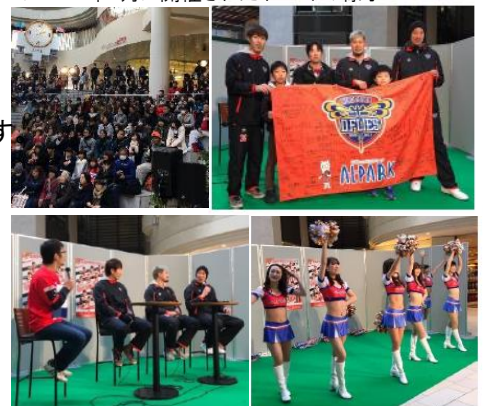
▼2017年1月に開催されたイベントの様子

★ アルパークは、タイアップイベントなどを通して、2017年も広島ドラゴンフライズを応援してまいります。