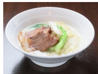
独自製法による画期的 牛骨ら〜めん専門店