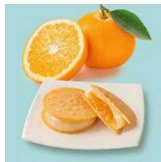
厚生労働大臣賞を受賞した （株）にしき堂（広島県）・瀬戸内 の八潮せとこまち