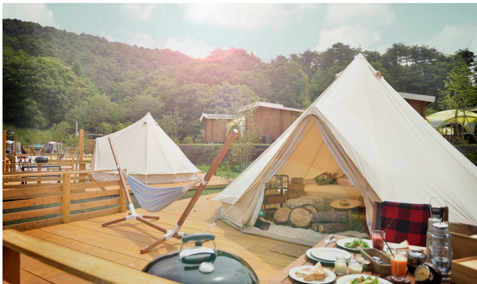
▶GRAX PREMIUM CAMP RESORT 京都 るり溪

「スプリングスひよし」から車で約40分に位置する「GRAX PREMIUM CAMP RESORT 京都 るり溪」は、ベッドやハンモックでくつろげる9タイプのサイトがあり、大自然の中でBBQを楽しみ、テント内のベッドで眠る、手ぶらで楽しめるグランピング施設です。周辺には、るり溪温泉や約2万冊以上の漫画や書籍を楽しめるスペースのランタンテラス、1年を通して光の世界を体験できるイルミネーション、地域の食材を使用したレストラン、焼きたてパンのあるカフェカーリーなどがあり、三世代で満喫できる高原リゾートです。