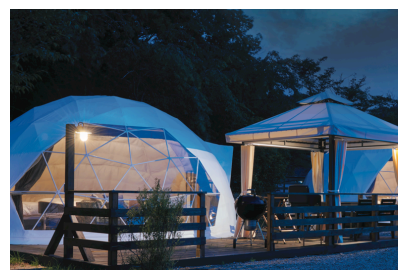
▶GRAX DOME AIR