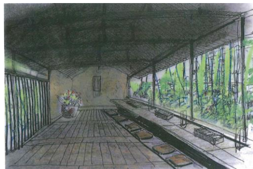
自然の空気と一緒に味わう七輪あぶり焼き