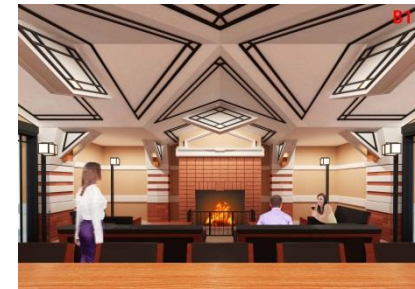
専用ラウンジ 内観