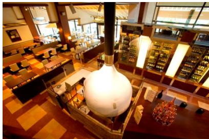
イタリアン 「トラットリア ソーニ・ディ・ソーニ」