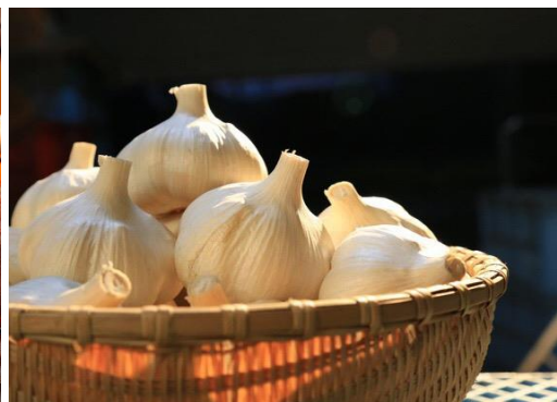
（左）牛肉との相性抜群 （右）青森県産にんにく「福地ホワイト六片」