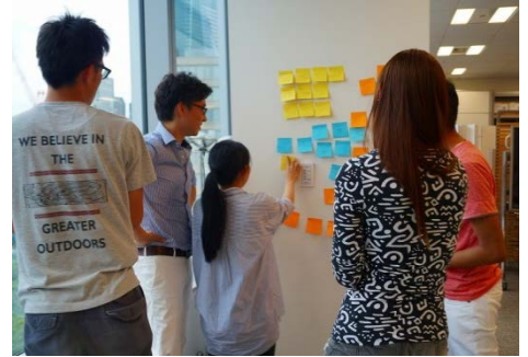
写真：ワークショップイメージ