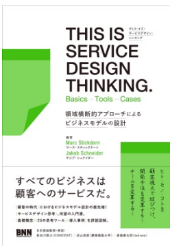
『THIS IS SERVICE DESIGN THINKING. Basics - Tools - Cases — 領域横断的アプローチによるビジネスモデルの設計』（監修）

わかりやすさのデザイン「情報アーキテクチャ」の第一人者。2002年株式会社コンセント設立、代表を務める。また、国際的なサービスデザインの組織 Service Design Network 日本支部代表も務め、デザインの新しい可能性であるサービスデザインを探索・実践している。NPO 人間中心設計推進機構 副理事長。著書、監訳、監修多数。