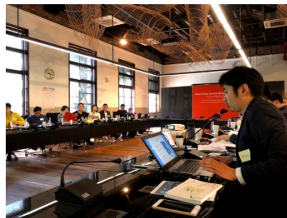
写真： 国際会議 Asian Public Service Design Allianceでの講演