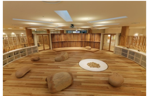
写真：「日南市子育て支援センター ことこと」