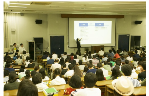
昨年のガイダンス風景（イメージ）