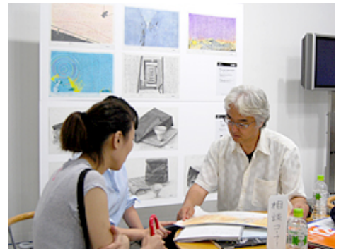
写真：相談会イメージ