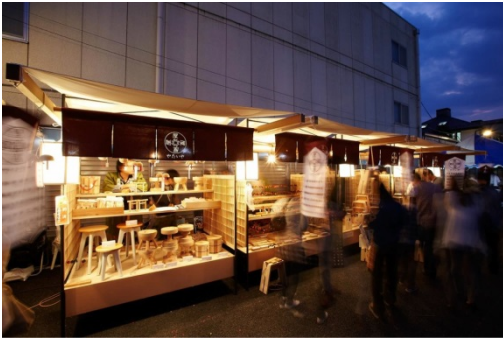
写真：「鹿沼のすごい木工プロジェクト」