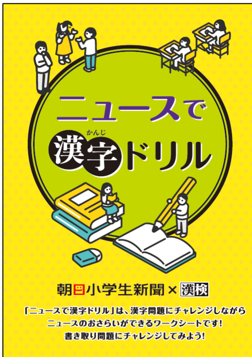
(【冊子版】ニュースで漢字ドリル 表紙)

当協会では全国の学校・教育団体への配布を行い、朝日小学生新聞・朝日中高生新聞では、オンラインセミナー等の各種イベント参加者への配布を予定しております。