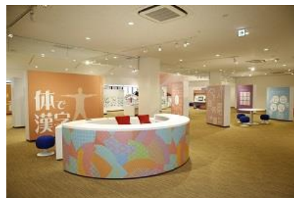
2階は20以上の体験型展示