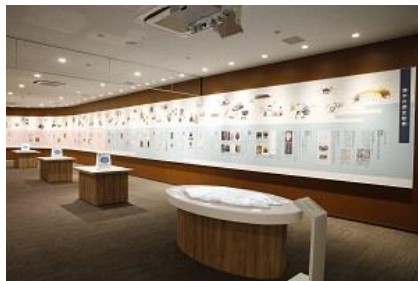
30メートルの漢字歴史絵巻