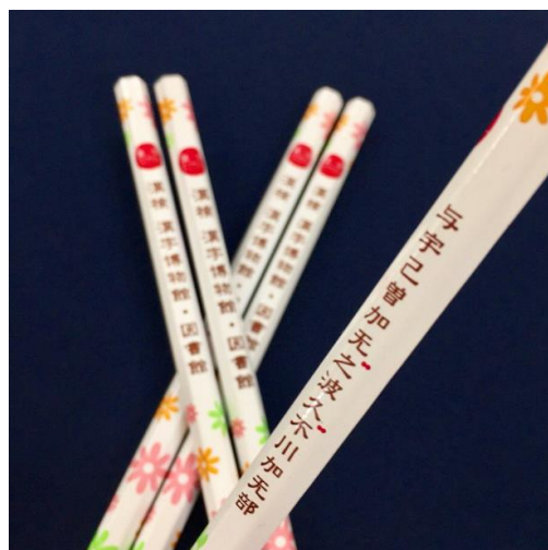
来館者40万人記念プレゼント 漢字ミュージアムオリジナル鉛筆