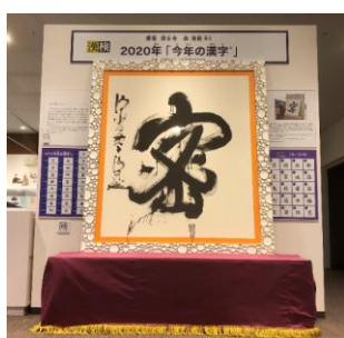
「今年の漢字®」の大書