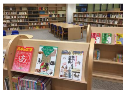
約4,500冊を閲覧できる図書館