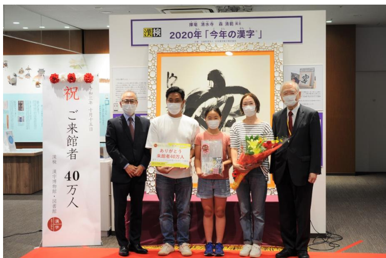
来館者40万人セレモニーの様子

「漢検 漢字博物館・図書館」(以下 漢字ミュージアム) (本部:京都市東山区/館長:高坂節三)は、2016年6月29日に開館し、5年4か月目となる2021年10月に累計来館者40万人を達成しました。これを記念してセレモニーおよびプレゼント企画を実施します。