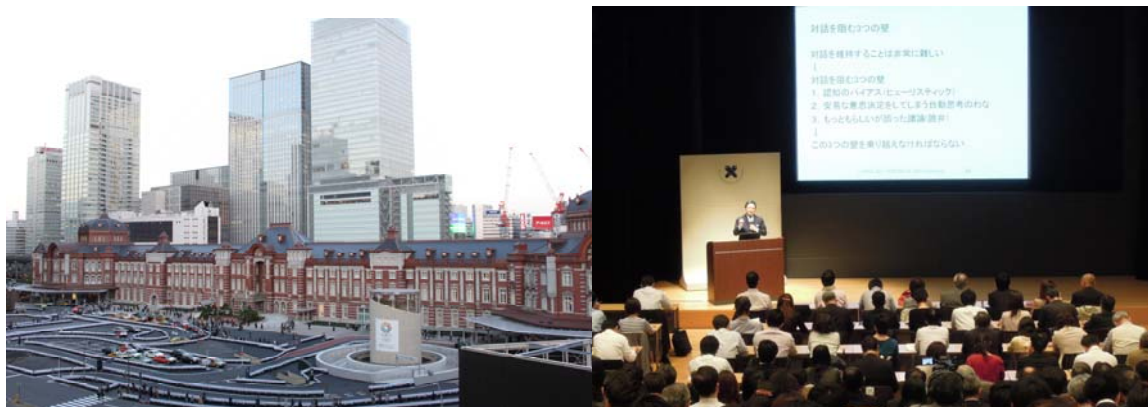
慶應が東京・丸の内で開催している著名講師陣による人気の講演会『夕学五十講』が全国で受講可能に 慶應MCCのある東京駅丸の内口（写真左）、慶應MCC主催『夕学五十講』の会場丸ビルホール（写真右）