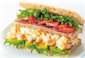
えびとアボカド塩レモン仕立て 本体価格430円（税込464円）