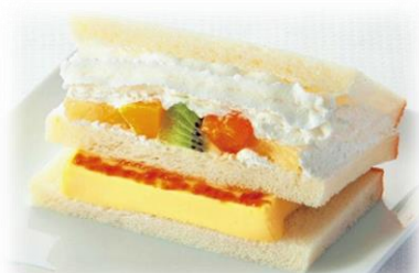
プリンアラモード 本体価格380円（税込410円）