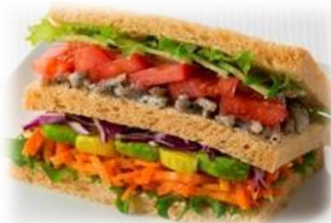
7種の野菜のレインボーサンド 本体価格330円（税込356円）