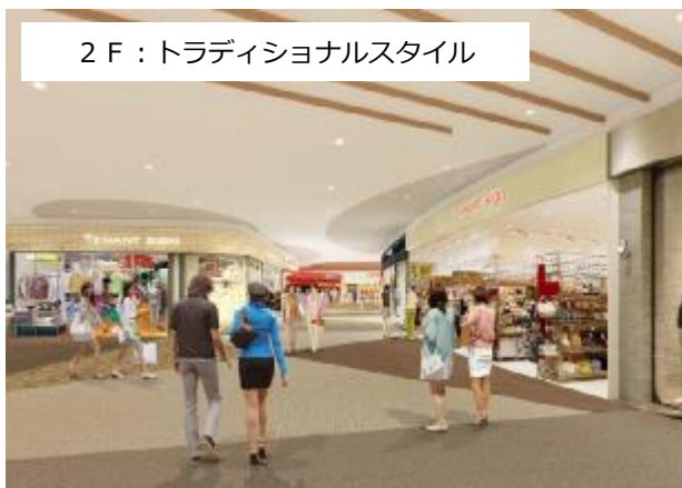
2F：トラディショナルスタイル