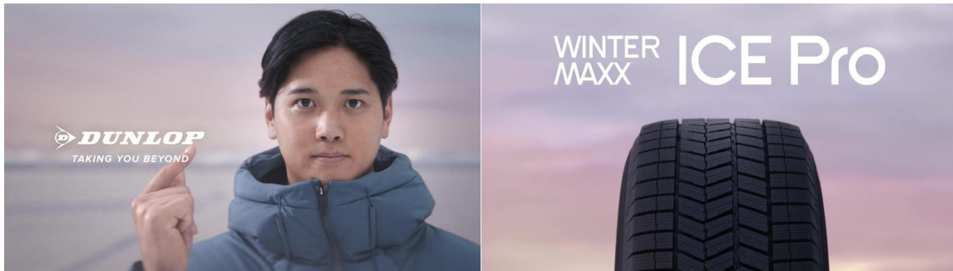
<新 CM ビジュアル>

DUNLOP (社名:住友ゴム工業(株)、社長:國安恭彰)は、2026 年 8 月より順次発売を発表した新商品スタッドレスタイヤ「ICE Pro(アイスプロ)」の CM に、大谷翔平選手を起用しました。DUNLOP ブランド CM、次世代オールシーズンタイヤ「SYNCHRO WEATHER(シンクロウェザー)」 ※1 CM 第一弾、第二弾に引き続き 4 度目の出演となります。