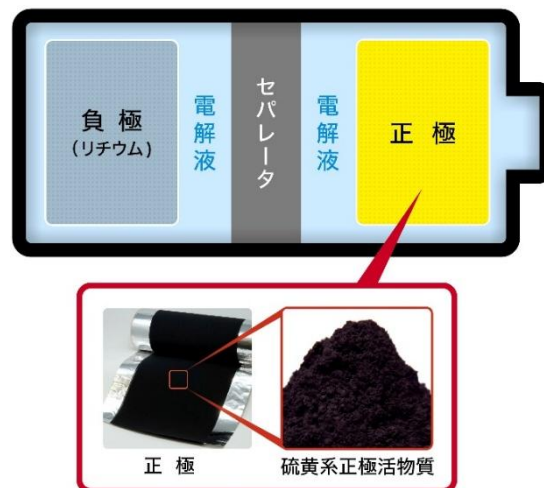
図1: リチウム硫黄電池の概略図

今回、ナノテラスのビームライン BL10U *4 を用い、テンダー-X線領域 *5 における硫黄 K 殻吸収端近傍 *6 の4つのX線エネルギー(硫黄の化学結合状態の違いに応じて吸収特性が変化する特徴的なX線エネルギー)を選択し、X線タイコグラフィ-計算機断層撮影 *7 を実施しました(図2)。