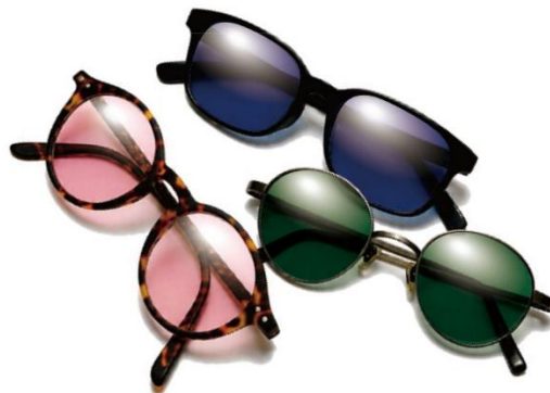
※レンズカラーはイメージです

今回、新たに対応する「サンテックミスティ」は、自然でやわらかな色づきが特長の調光レンズ。「まぶしさ対策で色のついたメガネがいいけれど色が濃いのには抵抗がある」という方におすすめの調光カラーです。