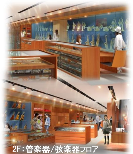
2F: 管楽器/弦楽器フロア

弦楽器: モラッシーファミリーやピッソロッティファミリーをはじめとするイタリア・クレモナ新作からヨーロッパの銘器、国内外の各ブランドまで。フランスの新作弓まで東北エリア随一の展示量を誇ります。