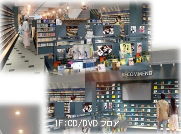
1F: CD/DVD フロア