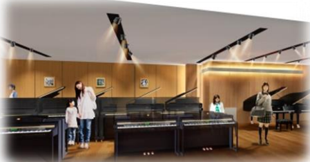
3F: ピアノ/楽譜フロア