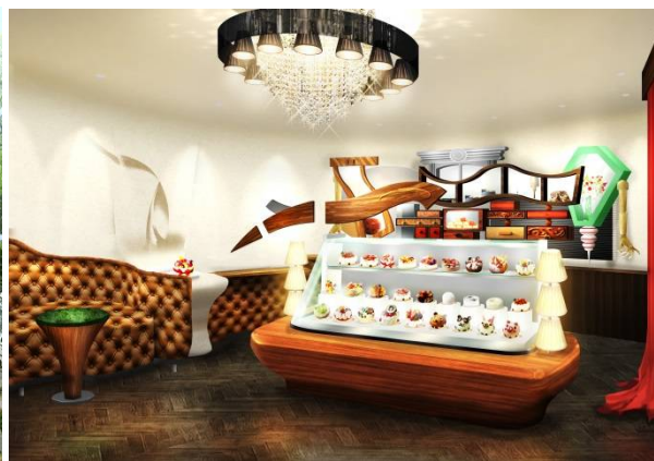
ファンタジー・ディレクター 店内・ショーケース