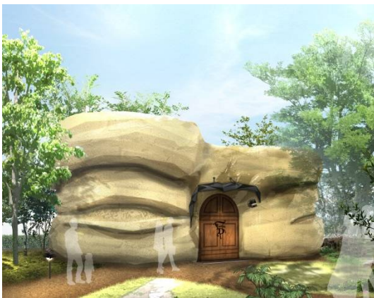
ファンタジー・ディレクター 外観

記念日などの大切な日に、贈るお客様には「こんなケーキが欲しかった!」、贈られたお客様には「こんなケーキ、見たことない!」という驚きと楽しさに満ちた体験を。「Fantasy Director(ファンタジー・ディレクター)」は、お客様の持つイメージをお聞きしながら、言葉では言い表せないことにまでパティシエが想像力・創造力を発揮し、1点もののデコレーションケーキを生み出す店舗です。