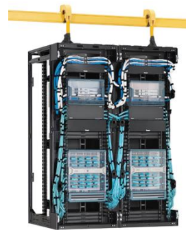
機器搭載・配線例