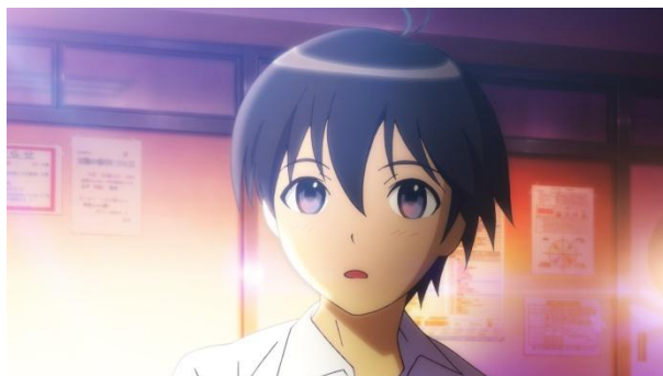
春香に心を奪われる祐介