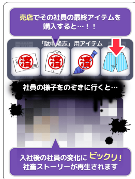
④ 全てのアイテム付与で…？