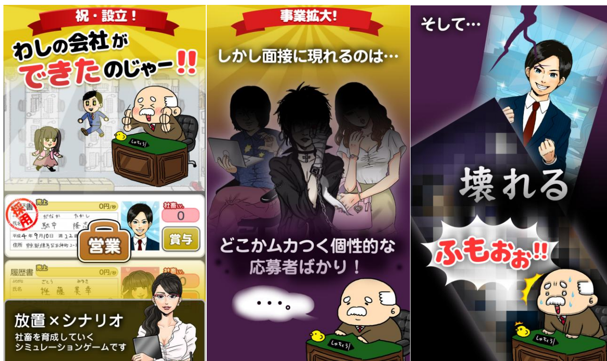
アプリイメージスクリーンショット

特に、入社時より仕事を通じ社畜へと変貌を遂げる社員たちの、豪華スチル、爆笑ストーリーは必見となっております。