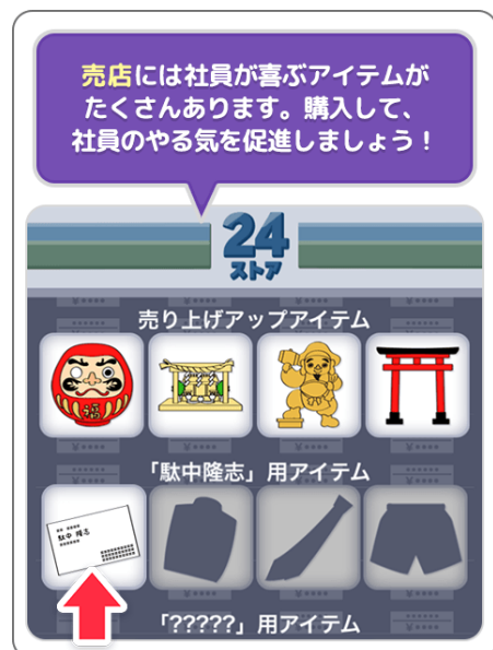
③ 社員にアイテムを与え活性化！