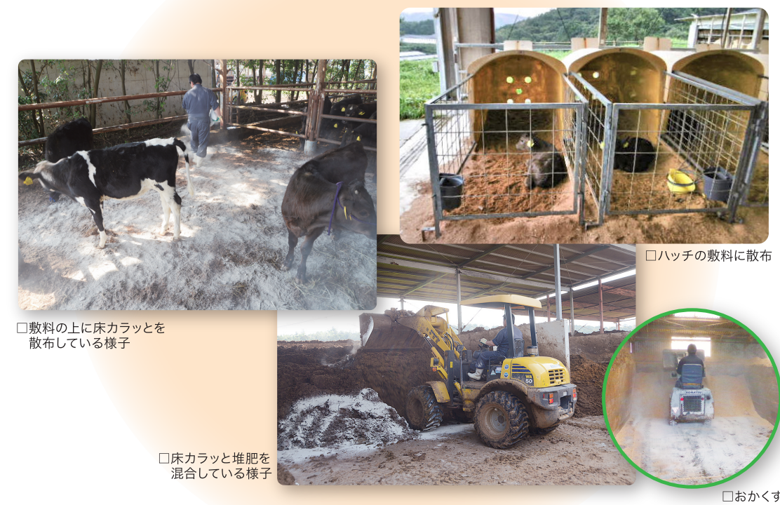
□敷料の上に床カラットを散布している様子