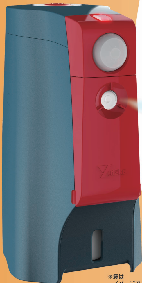
※霧はイメージです。