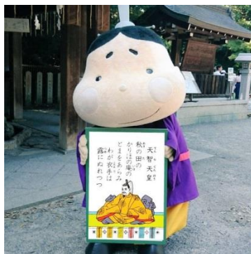
市内に出現する巨大かるた