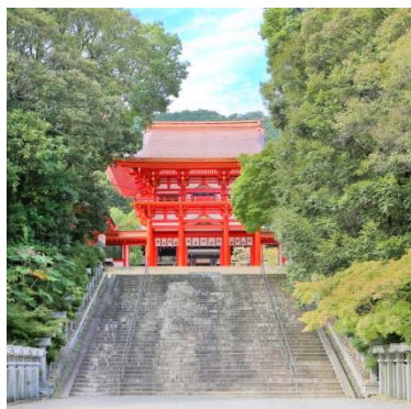
かるたの聖地「近江神宮」

なお当期間中は、多くの方がかるたを満喫できるよう、近江勸学館や比叡山延暦寺、三井寺等の百人一首ゆかりの場所をはじめ、市内のいたるところに大会公式かるた札メーカーである大石天狗堂が制作した巨大かるた（80cm×50cm）を設置します。ぜひ巨大かるたを通じて春の大津を楽しんでいただき、キャンペーンに御応募ください。