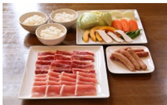
※昼食バーベキュー(3名分イメージ) (約60分イメージ)

甲賀忍者発祥の地で、自然を満喫しながら、みずからが忍者になった気分でお楽しみください。