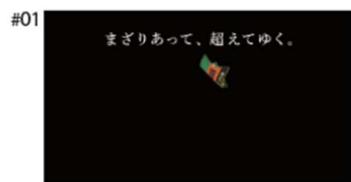
Na: ダイドーブレンド