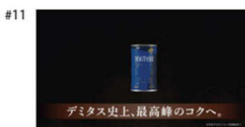
タイトル: デミタス史上、最高峰のкокへ。