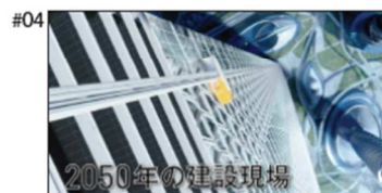
タイトル: 2050年の建設現場