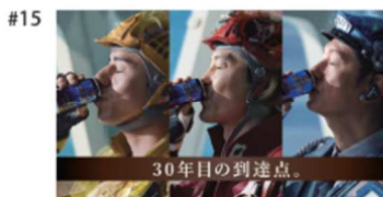
タイトル: 30年目の到達点。