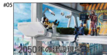
満島 「前人未到の地上500階!」 井浦 「ついに完成だな」