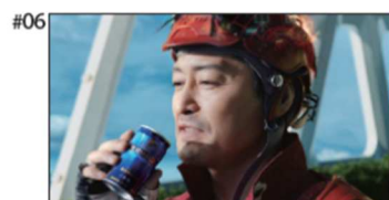
安田 「いま俺たちは、 人類の