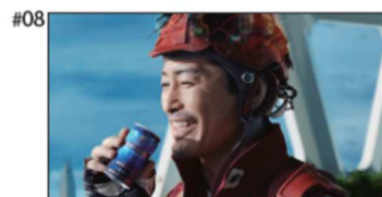
立ってるんだよな。」