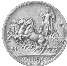
8. イタリア 5リレ銀貨 1914 クアドリガ Dav144 KM56 Matt Proof FDC