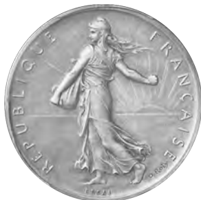
4. フランス 5フラン試作銀貨 1898 Gad750 Maz2122 KMPn99 PCGS SP64 Matt Proof FDC