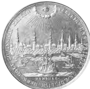
5. ドイツ・ハンブルク 10ダカット金貨 ND(1697-1700) ホルトガロッサー Gaed1685 P/L UNC