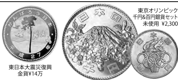
東日本大震災復興金貨¥14万