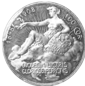
2. オーストリア 100コロナ金貨 1908 雲上の女神 Fr514 KM2812 PCGS MS62 P/L UNC