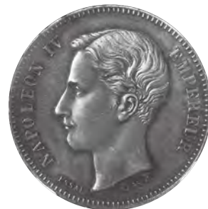
3. フランス ナポレオン4世5フラン試作銀貨 ビエフォー 1874等 5種完全揃いセット