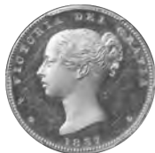
7. イギリス 1しポレン試鑄金貨 1837 WR295(R5) PCGS PR63DCAM Proof AU/UNC