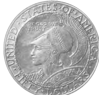
9. アメリカ 50ドル金貨 1915 パナマ太平洋博覧会記念 Fr188 KM138 PCGS MS62 UNC