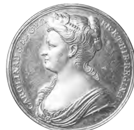
6. イギリス キャロライン王妃戴冠記念金メダル 1727 Eimer512 EF+