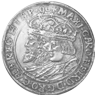
1. 神聖ローマ帝国 三皇帝ターレル銀貨 1590 Dav8105 Voglhuber86 Tone EF