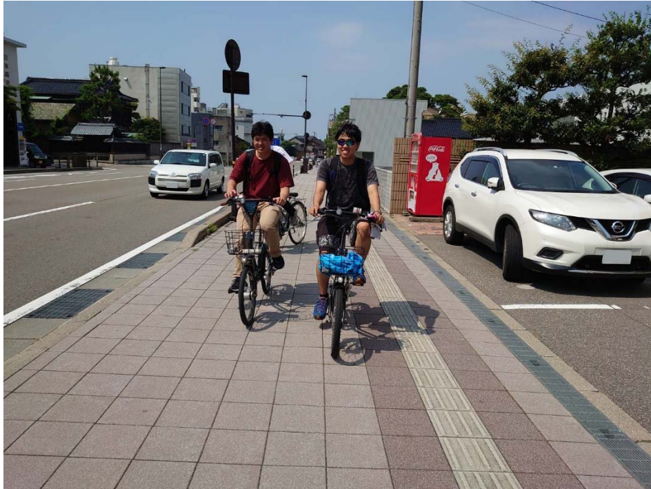
まちなりで市内を観光(イメージ)