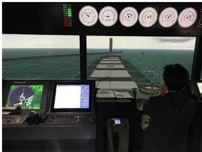
シミュレーターによるブリッジからの船体と硬翼帆のビジュアル

(註1) ウィンドチャレンジャープロジェクトは2009年に東京大学が主宰する産学共同研究プロジェクト「ウィンドチャレンジャー計画」として始まり、2013年からは国土交通省による「次世代海洋関連技術研究開発費補助金」の交付対象事業の1つに選ばれました。2018年1月からは産学共同