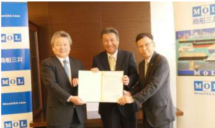
証書授与式の様子

風力エネルギーを用いて温室効果ガス（以下、GHG）の削減を目指すウィンドチャレンジャープロジェクトでは商船三井と大島造船所が中心となりプロジェクトメンバー（註2）とともに研究開発を行ってきましたが、今回のAIP取得により、硬翼帆の構造およびその制御に関する基本設計が終了したことになります。