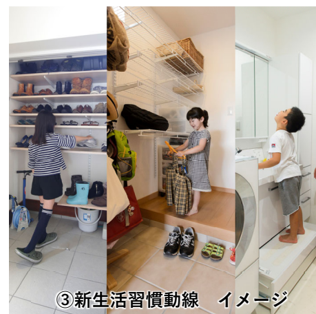
③新生活習慣動線 イメージ

面倒な家事をラクにするのが「洗濯・乾燥→たたむ→収納」を一か所に集約したアクティブストレージ。キッチンやリビングへもぐるっと廻れる動線なので、家事の効率も高まります。洗面も並んでいるので多くの家事のあれこれがここで一気に納まっちゃう！家族に大人気の家事コーナーです。