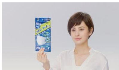
NA フィットイのマスクは