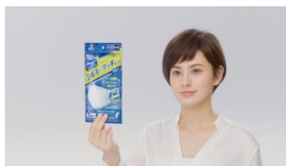
NA フィッティのマスクは