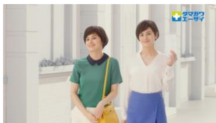
ホランさん 「今日の私も」