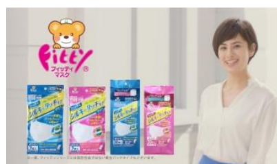
ホランさん 「毎日がフレッシュ！ マスクはフィッティ！」