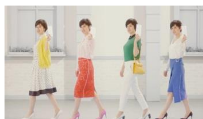
ホランさん 「持ち歩きにも便利！」