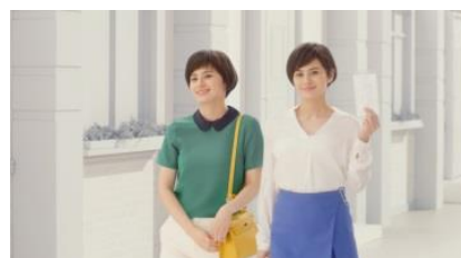
ホランさん 「今日の私も」