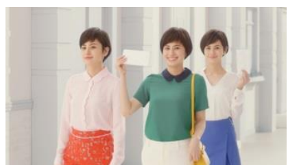
ホランさん 「あしたの私も」