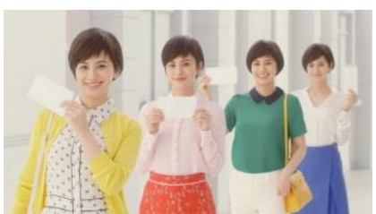
ホランさん 「開けたてのマスク」