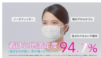
NA ぴったりフィットは もちろん！