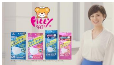
ホランさん 「毎日がフレッシュ! マスクはフィットイ！」