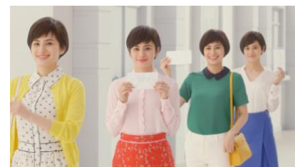
ホランさん 「毎日 フレッシュな」