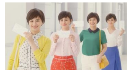
ホランさん 「開けたてのマスク」