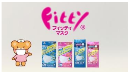
NA マスクはフィットイ!