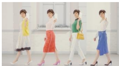
ホランさん 「便利で衛生的！」