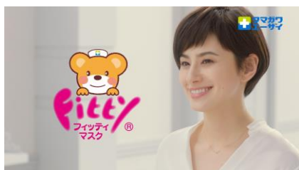
NA マスクはフィッティ！