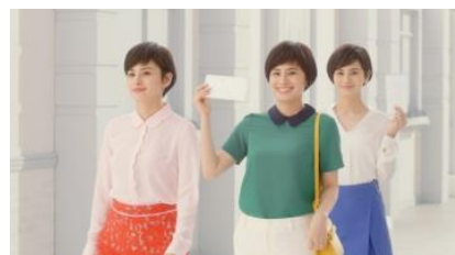
ホランさん 「あしたの私も」