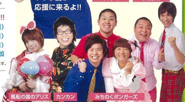
風船の国のアリス