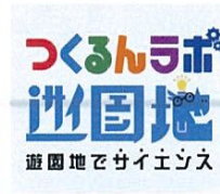
つくろんラボ遊園地でサイエンス