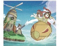
新アトラクション「フライング サブマリン」