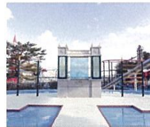
恋人の聖地サテライト

那須の自然に囲まれたレジャーランド「那須ハイランドパーク」は10大コースターをはじめ、人気のアトラクション、イベント館など、大人も大満足の楽しさです。