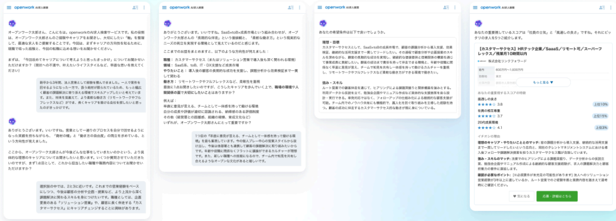
※会話の一部を抜粋

対話による言語化のサポートと客観的な判断に基づく求人の提案を受けることができます