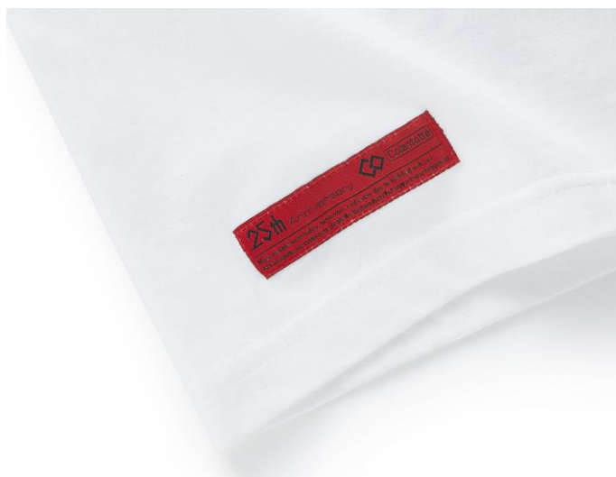
右裾の25周年記念タグ