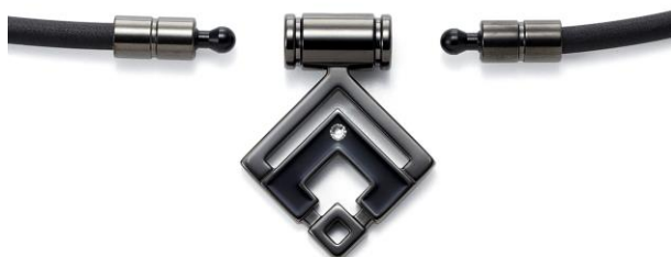
正面/ジョイント部

■ ジョイントを兼ねたトップ部分は、左右どちらからでも外せる設計。ループとトップが独立した構造なので、しなやかでやわらかい着け心地で首回りにフィットします。