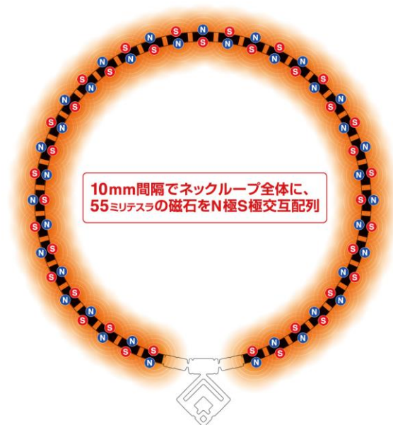
磁石配置イメージ図