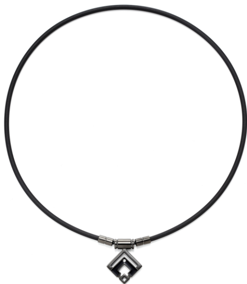
ブラック×ブラック