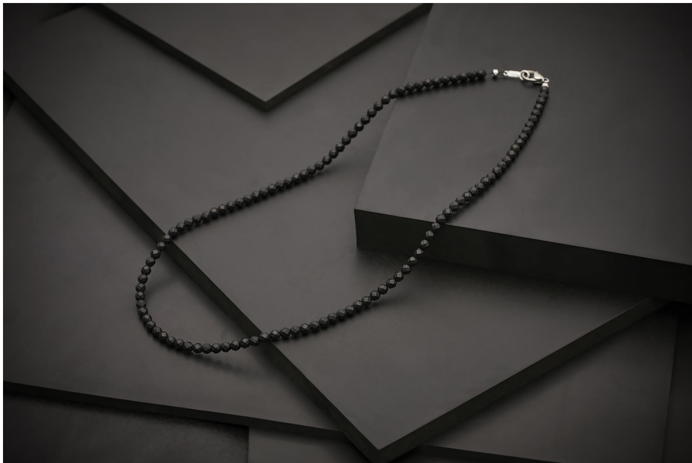
「コラントツテ ネックレス LUCE α Matte」 価格¥24,200/税込

磁気健康ギア「Colantotte（コラントツテ）」の製造・販売元である株式会社コラントツテ（本社：大阪市中央区、代表取締役社長：小松 克己）は、LUCE シリーズの中で最高磁束密度（100mT）を誇る磁気ネックレス LUCE αからマットタイプモデル「コラントツテ ネックレス LUCE α Matte（ルーチェ アルファ マット）」（価 ¥24,200/税込）を4月6日より販売いたします。