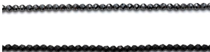
「LUCÉ α」 との比較