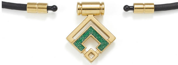
正面/ジョイント部