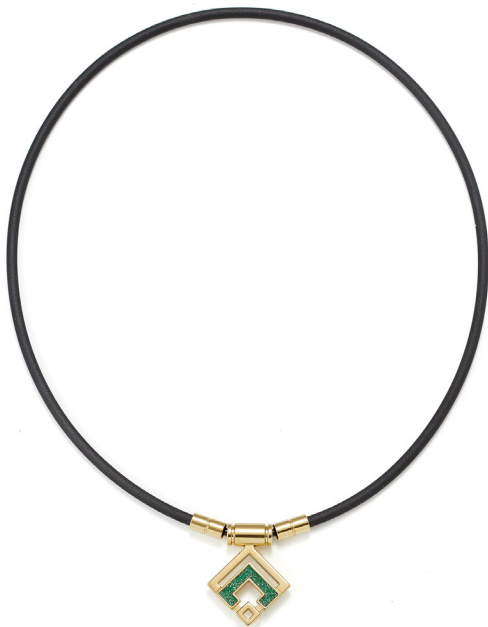
クラシックゴールド×グリーンラメ