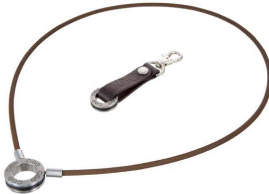
本事例の商品「CSS キーホルダー」