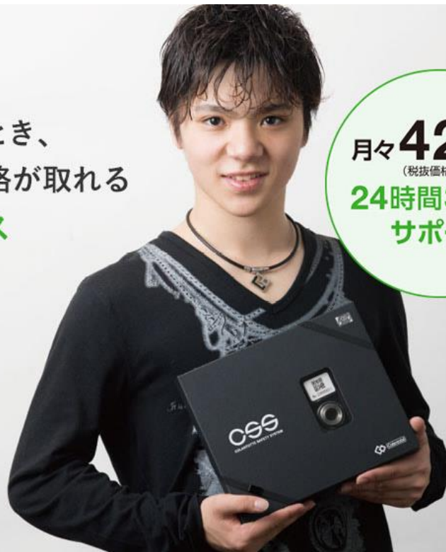
宇野昌磨選手 (トヨタ自動車)