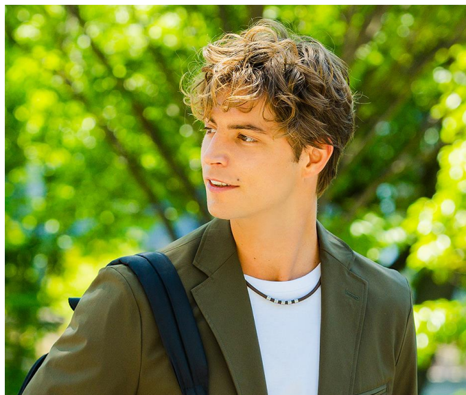
着用イメージ（ブラウン）