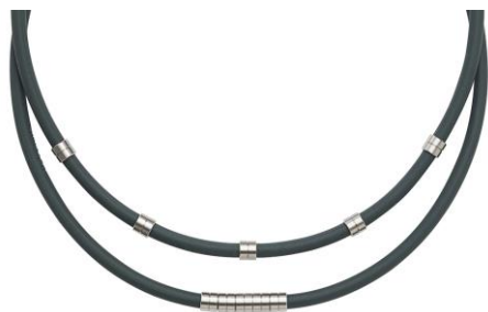
可動式装飾リング