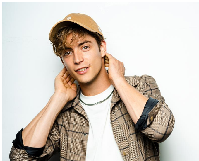
着用イメージ（カーキ）