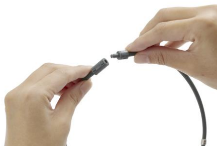
シリコンと同系色の留め具