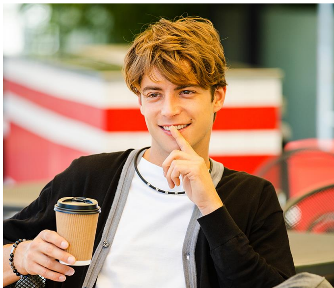
着用イメージ（ブラック）