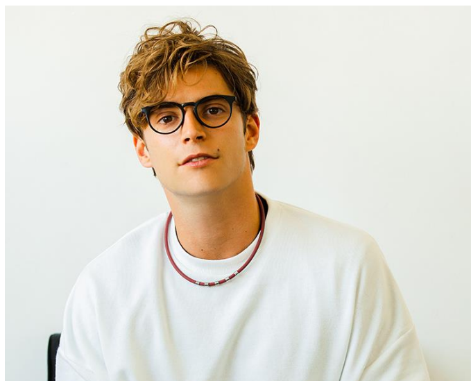
着用イメージ（ダークレッド）