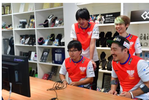
デュアルパッドを装着しながらゲーム対戦