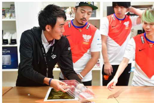
独自のN極S極交互配列の効果を説明