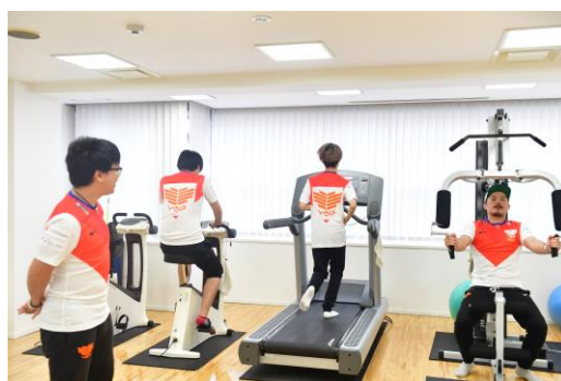
社内トレーニングジムにて運動