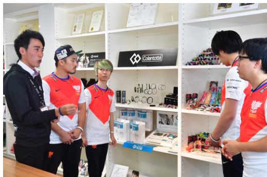
コラントッテ社員による商品説明

10月15日（火）コラントッテ本社に所属選手4名が来訪。会社の成り立ちや各種商品、磁気健康ギアの血行改善のメカニズムを紹介しました。また、選手たちの日頃の健康に対する悩みを聞き、それに応じたアイテムをお試しいただきました。