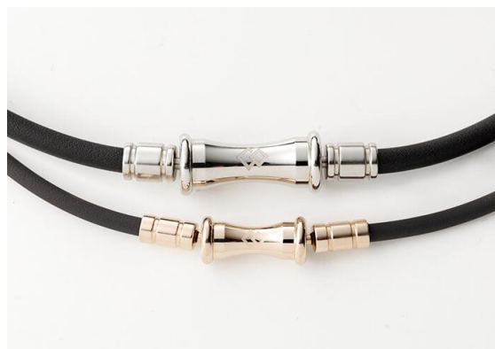
「TAO ネックレス RAFFI」との比較

高級感があるシンプルなデザインで普段使いでも特別な日にもさりげなくつけられます。既存の「TAO ネックレス RAFFI」とのペアアイテムとしてもお楽しみいただけます。