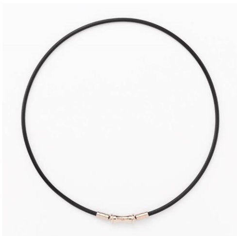
シャンパンゴールド