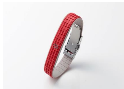
ガーネットレッド