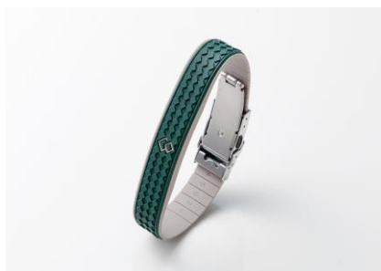
ハンターグリーン