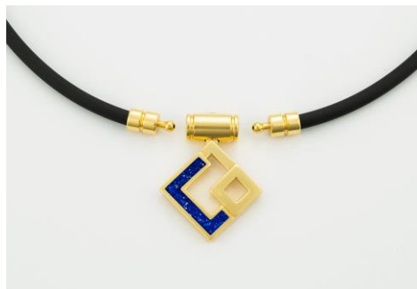
正面/ジョイント部