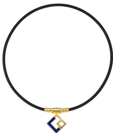
プレミアムゴールド×ブルーラメ