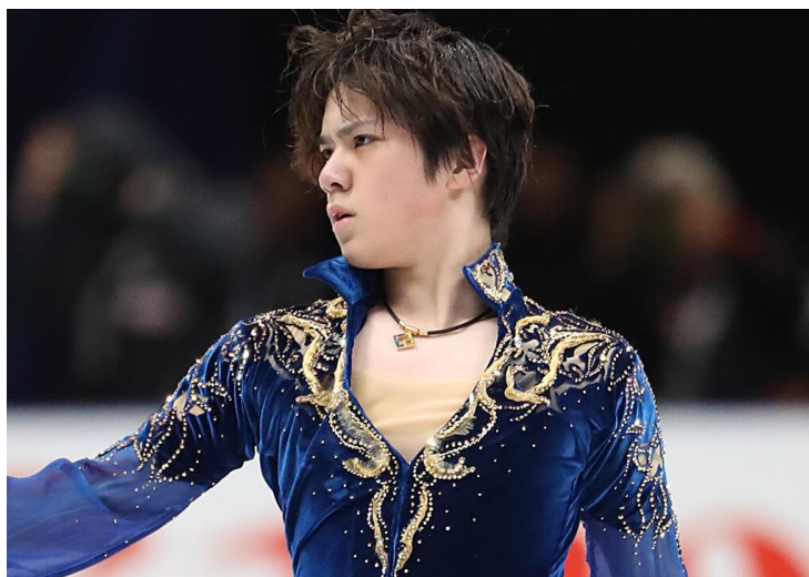
宇野昌磨選手のために製作された「プレミアムゴールド × ブルーラメ」が待望の商品化。 ペンダントトップ裏に「Shoma Uno 2018」の刻印が入った数量限定モデルです。

また「コラントツテ TAO ネックレス AURA 【SHOMA2018】」の発売を記念し、宇野昌磨選手をお迎えしてイベントの開催と購入者限定の「宇野昌磨選手 感動をありがとうキャンペーン」を実施いたします。