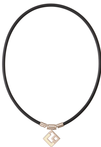
シャンパンゴールド×ホワイトラメ