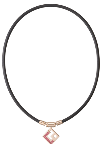
シャンパンゴールド×ピンクラメ