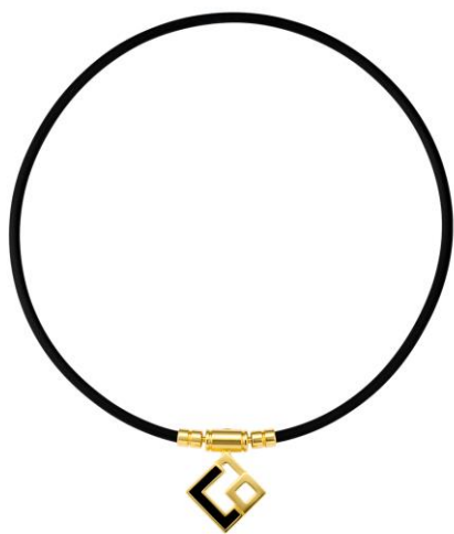
プレミアムゴールド