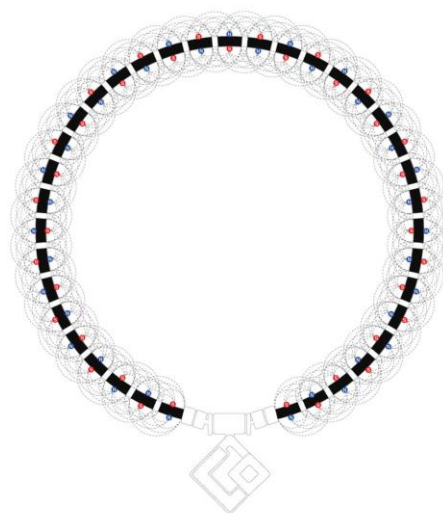
磁石配置 イメージ図