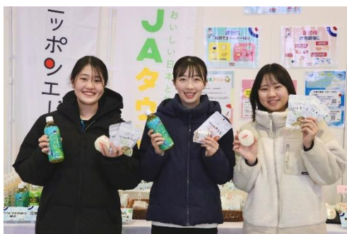
もぐもぐブースで食材を手にする選手

選手控室にブースを設置し、青森県産の青天の霹靂を使用したおむすびや、カットりんご、全農ブランド商品などの食材を提供しました。初めてブースを活用する選手も多く、「もぐもぐブースが楽しみ」「農協ミルクの芳醇メロンがお気に入り」などのコメントもいただきました。また、試合前後はもちろん、試合のハーフタイム中に、カットりんごで栄養補給するチームも見受けられました。