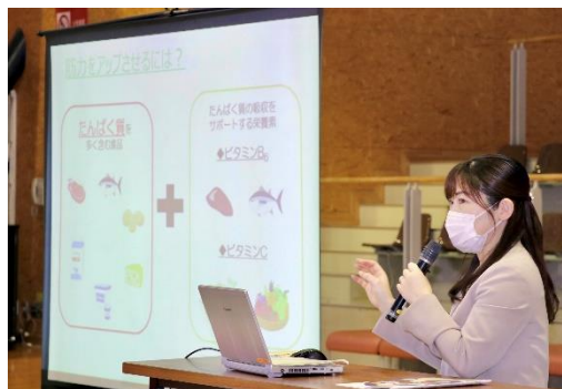
スポーツ栄養教室

大会初日、本会の管理栄養士が参加選手を対象に、試合前後の補食の取り方やバランスよく食べることの大切さを伝える講義を実施しました。運動前は、おむすびやおもちなどの糖質でエネルギー補給すること、運動後は疲労回復のために、糖質やたんぱく質を補給することが大切とアドバイスしました。