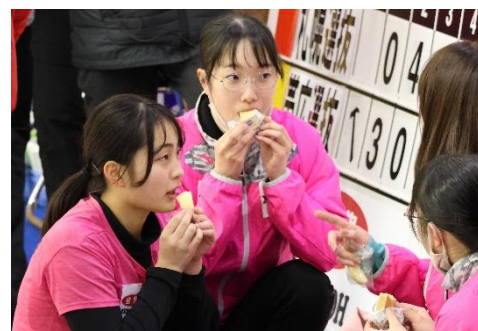
ハーフタイム中にもぐもぐ