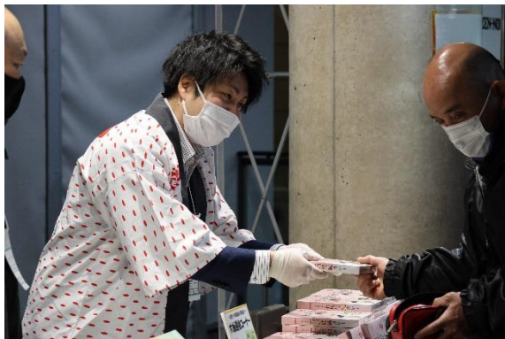
石川佳純（かすみん）カレー販売の様子

28日（土）・29日（日）は会場内の「全農ブース」で「石川佳純（かすみん）カレー」の販売と、商品購入者を対象とした大抽選会を行いました。抽選会の賞品は優勝選手に贈呈したJ Aタウンのギフトカードや、全農の商品ブランド「ニッポンエール」のグミセットなどで、お目当ての賞品が当選した来場者は笑顔いっぱい全農ブースを後にしました。さらに卓球用具メーカー・日本卓球株式会社とのクイズ企画を実施し、クイズに正解した方に「インスタントごはん」を1個プレゼントしました（先着順）。