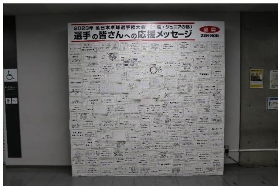
応援メッセージの展示風景

J A全農は会場内の選手の練習会場に、全国の卓球ファンからの出場選手への応援メッセージを展示しました。1月17日（火）からSNS上と会場で募集を開始し、期間中に計2,030件ものメッセージが集まりました（1月29日時点）。「選手のみなさんの活躍が、みんなに勇気や希望を与えてくれます」、「悔いの残らない試合ができますように」といったあたたかいメッセージが寄せられ、ファンの方々からのエールを選手の皆さんに直接お届けしました。