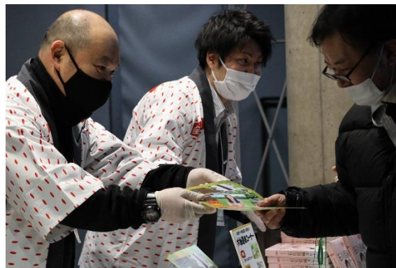
抽選会で賞品を受け取る来場者