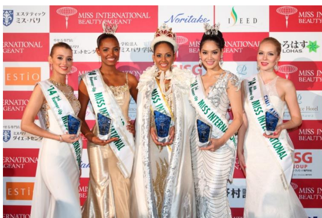
左からイギリス代表、コロンビア代表、プエルトリコ代表、タイ代表、フィンランド代表