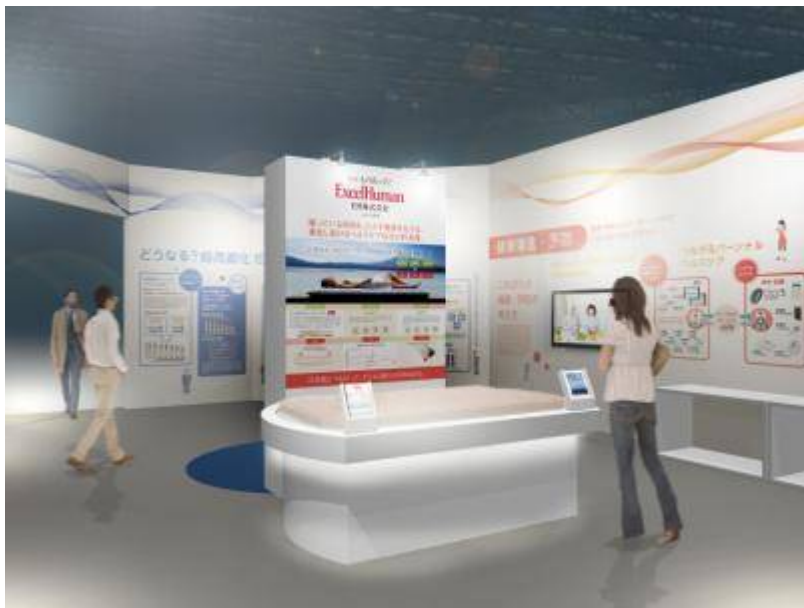
健康寝具『健康いちばん』展示コーナーのイメージ

今回の「未来 EXPO'15」で出展する「医療福祉 IT 展示」では、当社が製造・販売する健康寝具「健康いちばん」（医療機器認定）を展示するとともに、IT 技術を搭載した「次世代型健康いちばん」の構想なども紹介します。