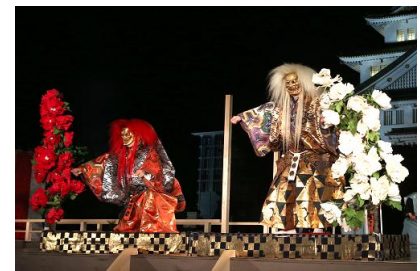
イメージ

大阪城天守閣をバックに、秋の夜を幻想的に彩るかがり火の中、熱気と活気に包まれた舞台が繰り広げられます。